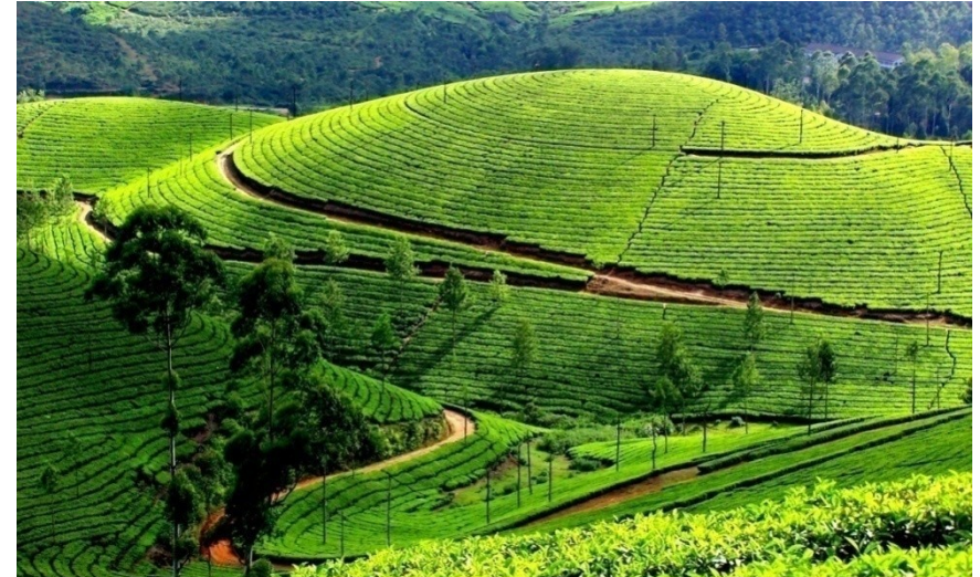
Excursion découverte dans les plantations de thé