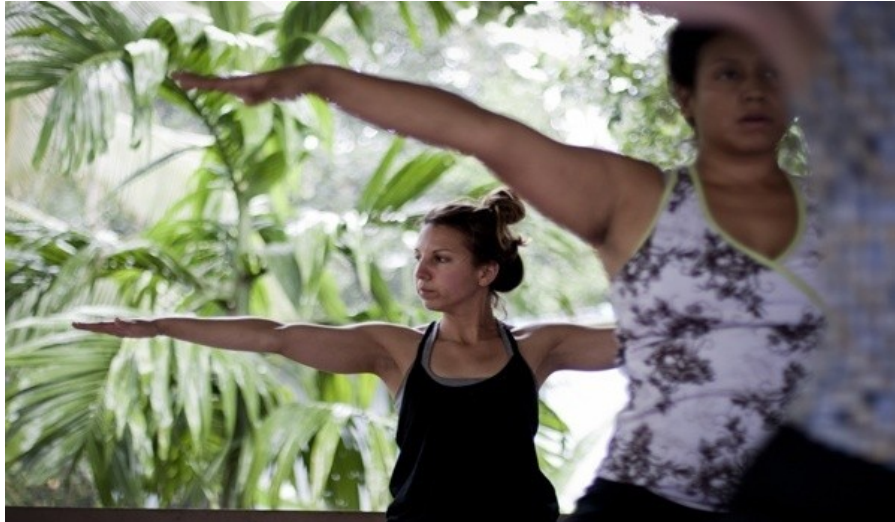
Cours de Yoga tous les matins