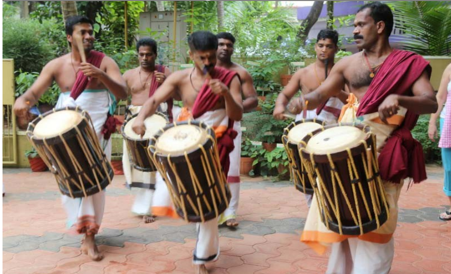
Balades sur la plage et danses traditionnelles