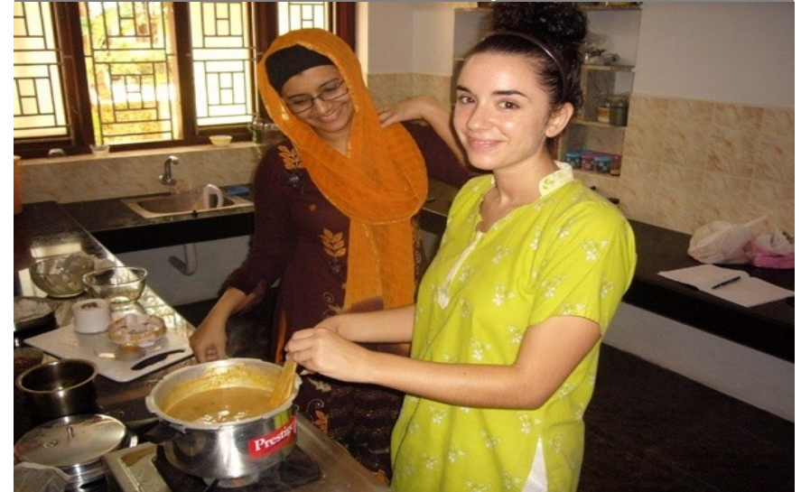
Cours de cuisine Ayurvédique